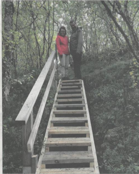
Ensimmäiset kulkijat rakennetuilla portailla.