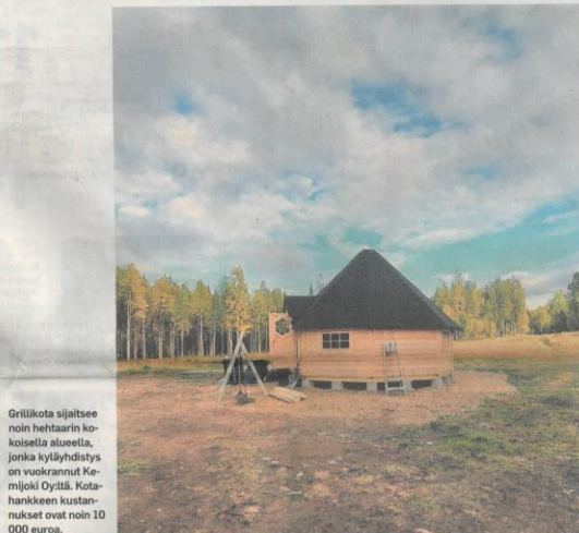
Grillikota sijaitsee noin hehtaarin kokoisella alueella, jonka kyläyhdistys on vuokrannut Kemijoki Oy:ltä. Kotahankkeen kustannukset ovat noin 10 000 euroa.

Vireässä kyläyhdistyksessä viritellään jo uutta juttua. Siinä asialla ovat nuoret, jotka tekevät fresbee-golf-radan grillikodan tuntumasta.