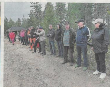
Madetkosken kylässä on alle 50 asukasta, mutta yli 250 mökkiä. Mökkiläisten tarkkaa lukumäärää ei tiedetä, mutta heidän joukostaan löytyi aktiivisia talonrahoitajia.