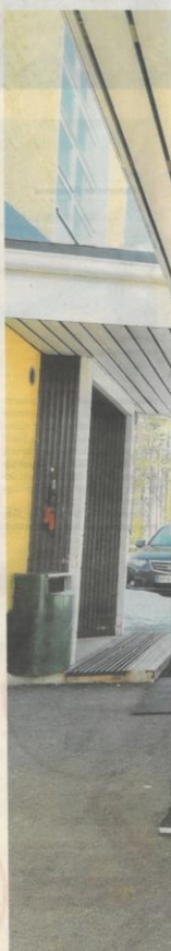
SVVJÄRVEN koulun 7. ja 8. luokkia

Nuorisoyhdistys huipentuu perjantaina 20. toukokuuta järjestettävään päätäjäsibileisiin, jonne odotetaan yleisöä myös järvikylästä: Sodankylän keskustasta. Tapahtuma kuulostaa miinifestivaalilta eri esiintyjineen. Päätäjäsibileet on ilmainen