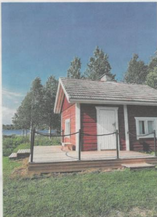
Oinaan koulun ympäristöä kunnostettiin kesän aikana. Nyt pihalla kelpaa viihtyä. Pihalla on esimerkiksi terassi ja lapulle keinuja.

Korona-aika viivästytti hankkeen toteutusta, mutta tänä kesänä rakentaminen onnistui. Tarkoituksena on järjestää koulun