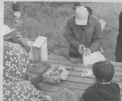
Teemahankkeeseen haetaan mukaan ensisijaisesti alueiden rekisteröityneitä yhdistyksiä ja erityisen tervetulleita ovat uudet Leader-hakijat.

Teemahankkeessa tartutaan koronatilanteen hankaloittamiin olosuhteisiin kylissä ja pyritään vahvistamaan kyläläisten viihtyvyyttä ja hyvinvointia. Erityisinä kohderyiminä kehittämishankkeissa huomi-