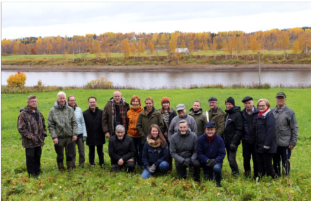
Edustajia useilta eri maisemanhoitoalueilta, Lapin ELY-keskuksesta, ympäristöministeriöstä sekä Suomen ympäristökeskuksesta Kairalan maisemissa lokakuussa 2022

Hanke on ollut järjestämässä yhdessä ympäristöministeriön ja Lapin ELY-keskuksen kanssa maisemanhoitoalueiden verkostoseminaaria, joka toteutettiin syksyllä 2022 valtakunnallisesti arvokkaalla maisemanhoitoalueella Kairalassa. Lapin alueella vastaavan statuksen ovat saaneet Tenojokilaakso Utsjoella ja Simonkylä. Sallan Saijan kylän maisemanhoitosuunnitelmaa päivitetään, joka mahdollistaa maakunnallisesti arvokkaan kohteen hakeutumisen valtakunnallisesti arvokkaiden kohteiden joukkoon. Lapin uusi kohde on Yläkemijoen kylämaisemien maisemanhoitoalue Rovaniemellä, jossa kyläyhdistyksen, Lapin ELY-keskuksen ja hankkeen yhteistyöllä järjestetään verkostoseminaari kesällä 2023.