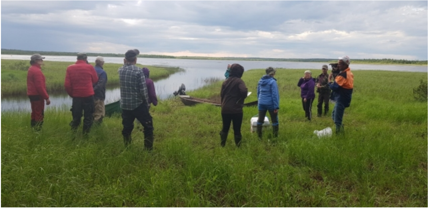
Kuva 4. Infotilaisuuden jälkeen halukkaat tulivat mukaan Soasjärvelle, josta otettiin samalla vesinäytteet.

olijoita ohjeistettiin ottamaan levää puhtaaseen 0,5l limpparipulloon ja laittamaan Matkahuollon kyydillä ELY-keskuksen levärinkiin.